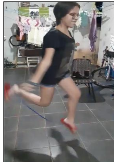
Data: 19/04/2021 Atividade: Retorno das atividades dos atendidos