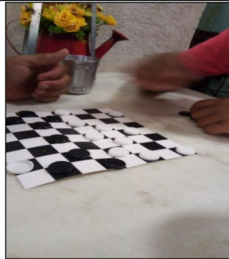
Data: 24/02/2021 Atividade: Devolutiva de um dos atendidos jogando dama com seus familiares.