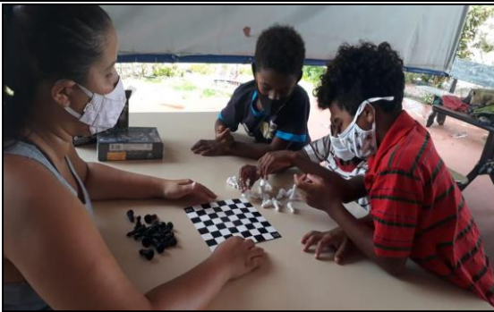
Data: 25/01/2021 Atividade: Jogo com os irmãos e a monitora